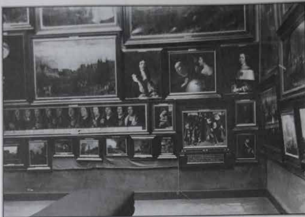
Zaal in Museum Kunstliefde, Oudegracht WZ 152 (nu Oudegracht 35) in 1906. Het museum zou bestaan tot 1918.

Een soortgelijke situatie herhaalde zich in 1898: eerst ging de ledenvergadering akkoord met het voorstel ook te gaan tekenen naar vrouwelijk naakt, maar in een volgende vergadering werd dat weer herroepen door een nieuwe meerderheid. Het tekenen naar vrouwelijk naakt werd bij Kunstliefde pas officieel ingevoerd in 1930, nadat er in de periode 1917-1930 helemaal géén tekenavonden hadden plaats gevonden, eerst 'in verband met de kolenschaarste', later vanwege algehele malaise van het genootschap. Nu is er nog minstens één keer per week een goed bezochte en hoog gewaardeerde tekenavond, die alleen toegankelijk is voor werkende leden.