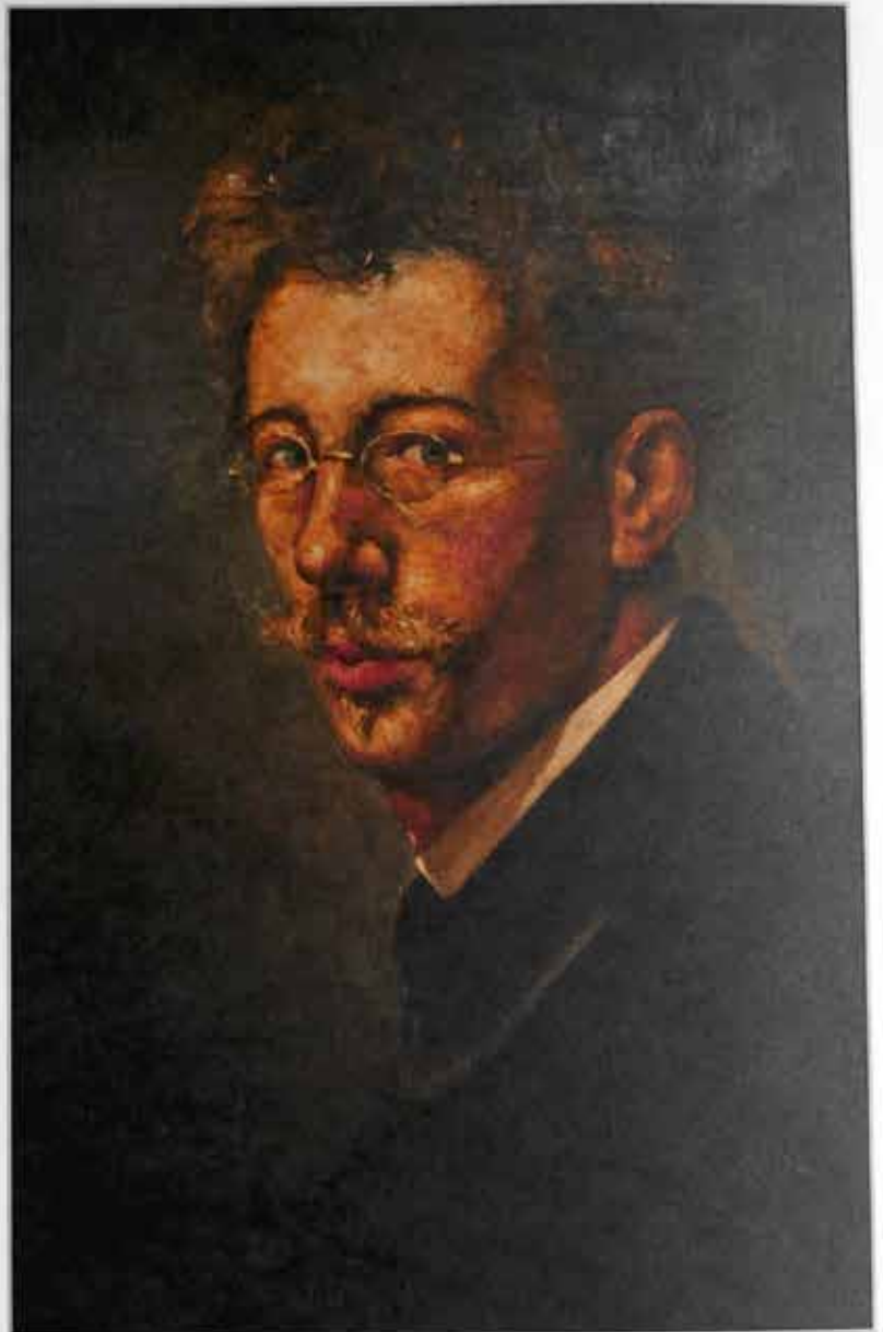
Willem van Leusden, Zelfportret olieverf/paneel, 1913 (52 x 42,5 cm). Particuliere collectie

Veelzijdigheid kenmerkt Van Leusdens omvangrijke en gecom-