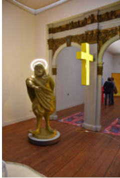
afb. POP UP 2016 Casper Braat

POP UP : vierdaagse tentoonstelling voor de selectie van de 12e editie van De Belofte