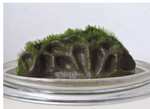
Afb. 'Nieuwe Liefde 16' Sonata Lepaite